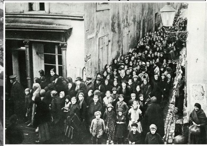
Илл. 12. Очередь за раздачей продовольствия в Берлине. 1917 г.