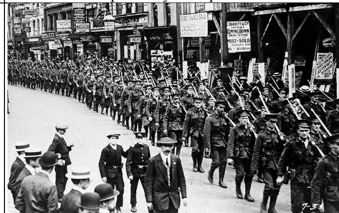
Илл. 6. Марш добровольцев в Лондоне, август 1914 г.