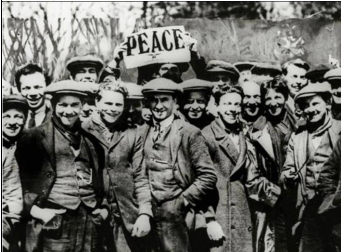
Илл. 10. Антивоенный митинг в Дортмуте, Англия, 1917 г.