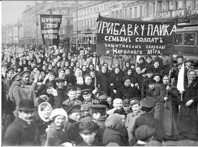
Илл. 8. Демонстрация женщин в Петрограде, 1917