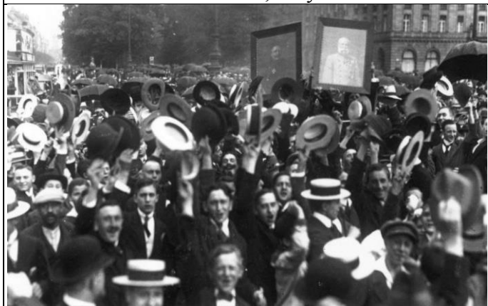
Илл. 4. Жители Берлина приветствуют объявление о начале войны, август 1914 г.