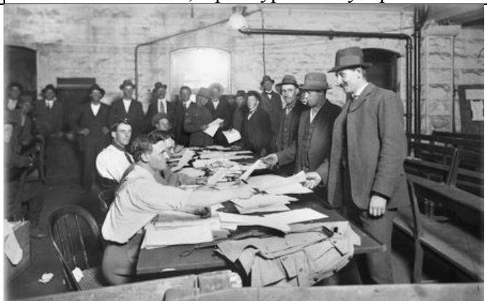
Илл. 5. Французские граждане на призывном пункте, август 1914 г.