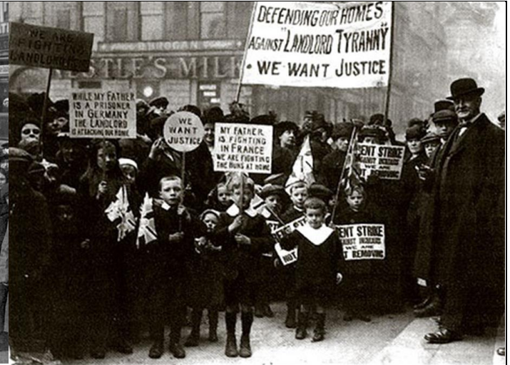
Илл. 9. Забастовка рабочих в Глазго, с требованием социальных реформ, 1916 г.