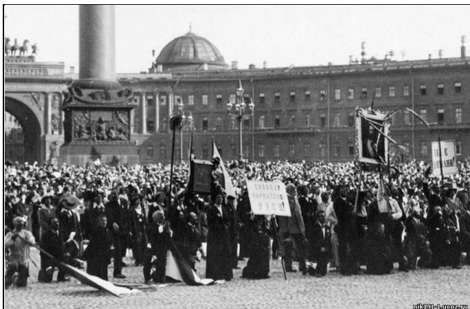
Илл. 1. Перед Зимним дворцом в день объявления войны, август 1914 г.