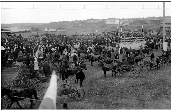
Илл. 2. Молебен о даровании победы, август 1914 г. Миасс, Оренбургская губерния.