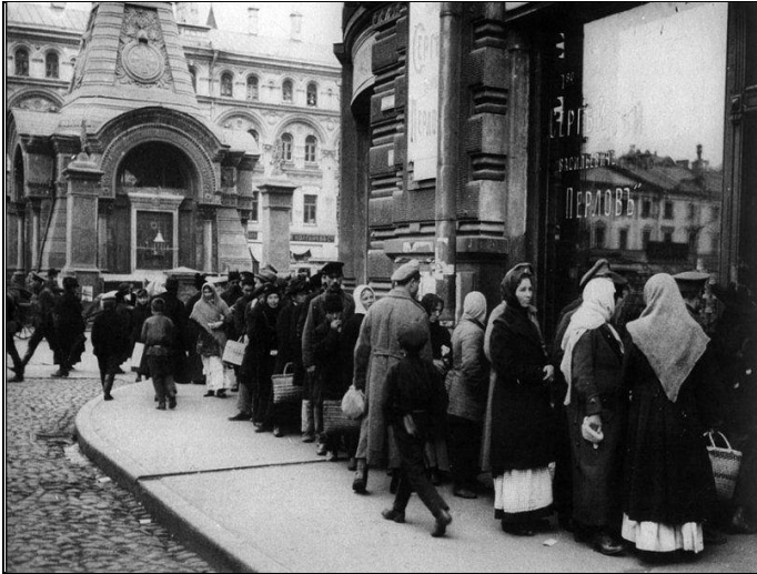
Илл. 7. Очередь у продовольственного магазина, Москва, 1916 г.