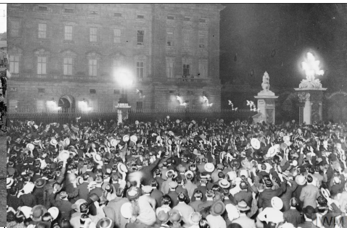
Илл. 3. Британцы перед Букингемским дворцом, приветствуют короля.